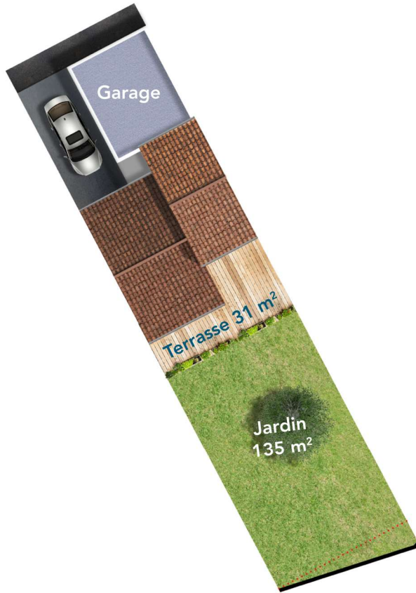
tableau des surfaces