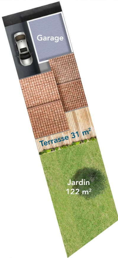
tableau des surfaces